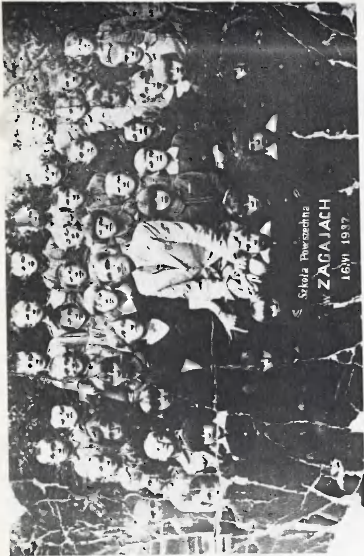
Szkola Powszechna w ZAGAJACH 16/VI 1937