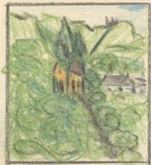
Klasztor na górze po stronie rumuńskiej