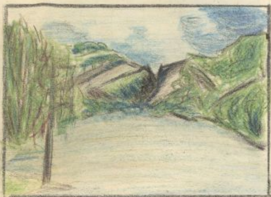
Spojrzenie z plaży Cienistej w Zaleszczykach.

(zakręt Dniestru) str. opł. kanał polski - praw. rumuński)